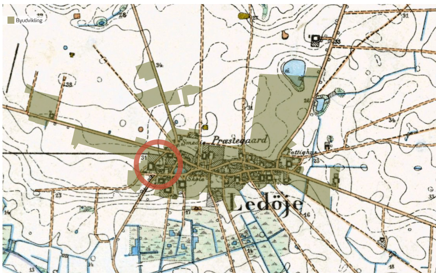
Historisk kort (1842-1899) af Ledøje med udpegning af Ledøje Kirke og byudviklingen i Ledøje.

Besøg kirken på Kirkevej 6 i Ledøje, og det er muligt efter aftale at komme op i tårnet og se de tydelige spor af landbrugslandets strukturer efter stjerneudskiftningen.