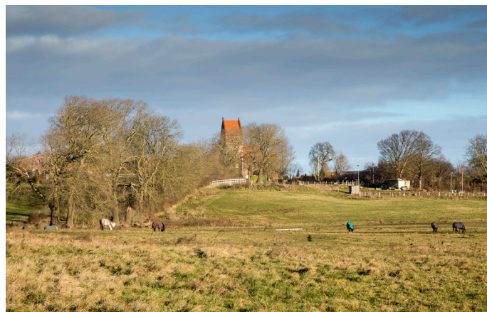
Ledøje Kirke er placeret på en bakke i den vestlige del af Ledøje. Efter aftale er det muligt at komme op i tårnet.

Ledøje Kirke ligger højt placeret i landskabet med udsigt langt omkring. Ledøje Kirke er Danmarks eneste dobbeltkirke og er opført omkring 1225 i romansk stil med skib og kor.